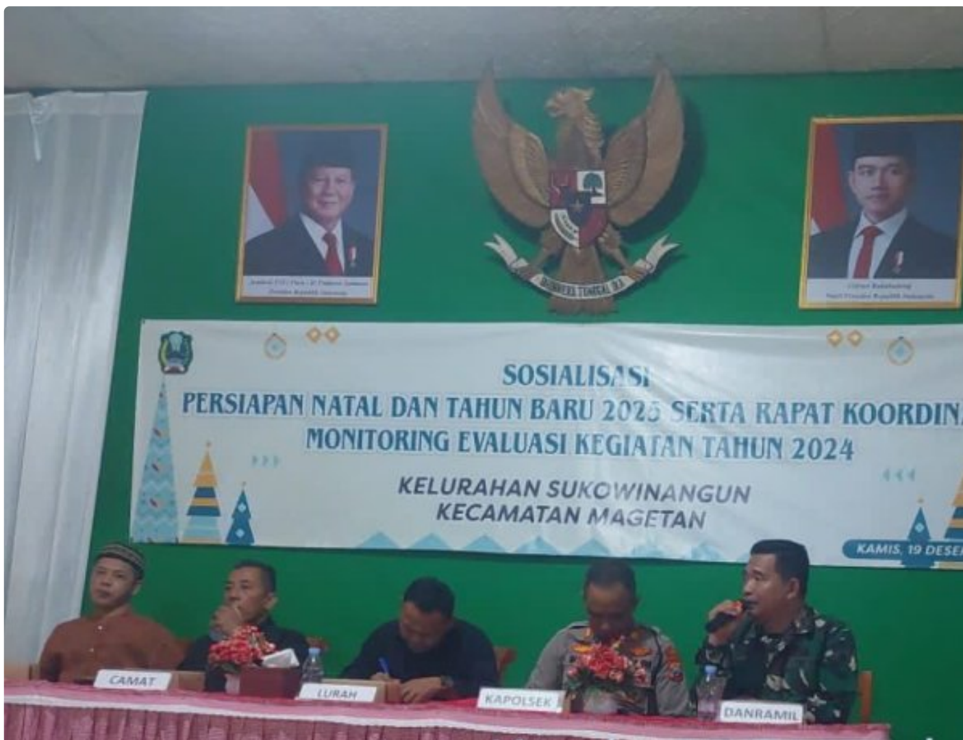
Danramil 0804/01 Magetan Bersama Forkopimca Hadiri Sosialisasi dan Persiapan Natal dan Tahun Baru 2025