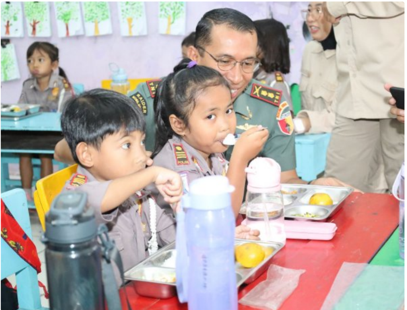
Dandim 0804/Magetan Bersama Forkopimda Dampingi Pemberian Uji Coba Makanan Bergizi Gratis