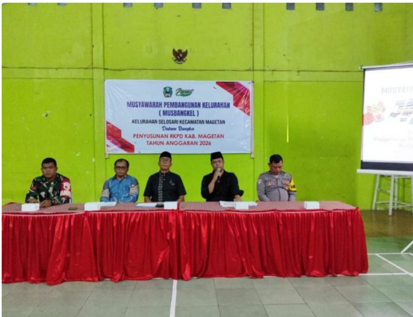
Babinsa Koramil 0804/01 Magetan Hadiri Musyawarah Pembangunan Kelurahan (MUSBANGKEL)